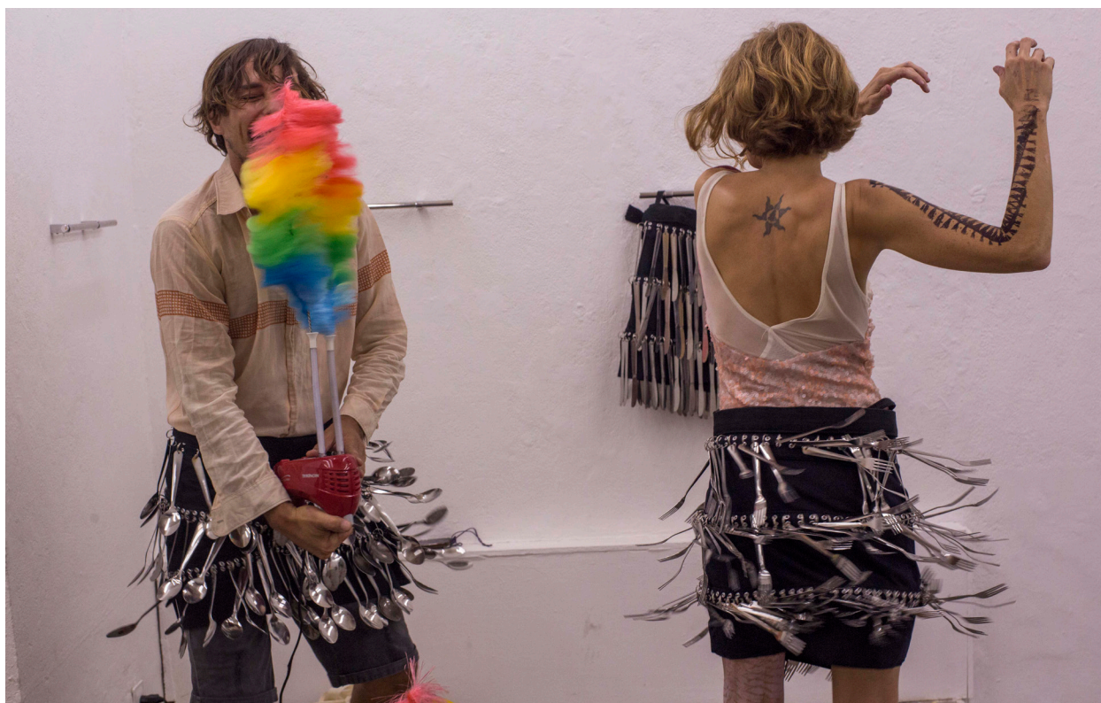
Fig 2. Pornorama_AMA4207 _ Pornorama, 2019