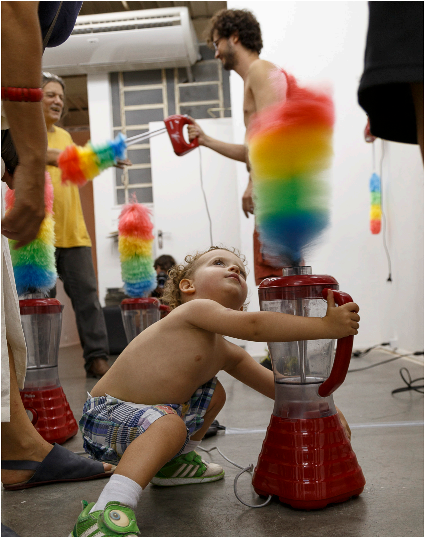
Fig 4. Pornorama_opa-pornorama-obras-048 _ Pornorama, 2019