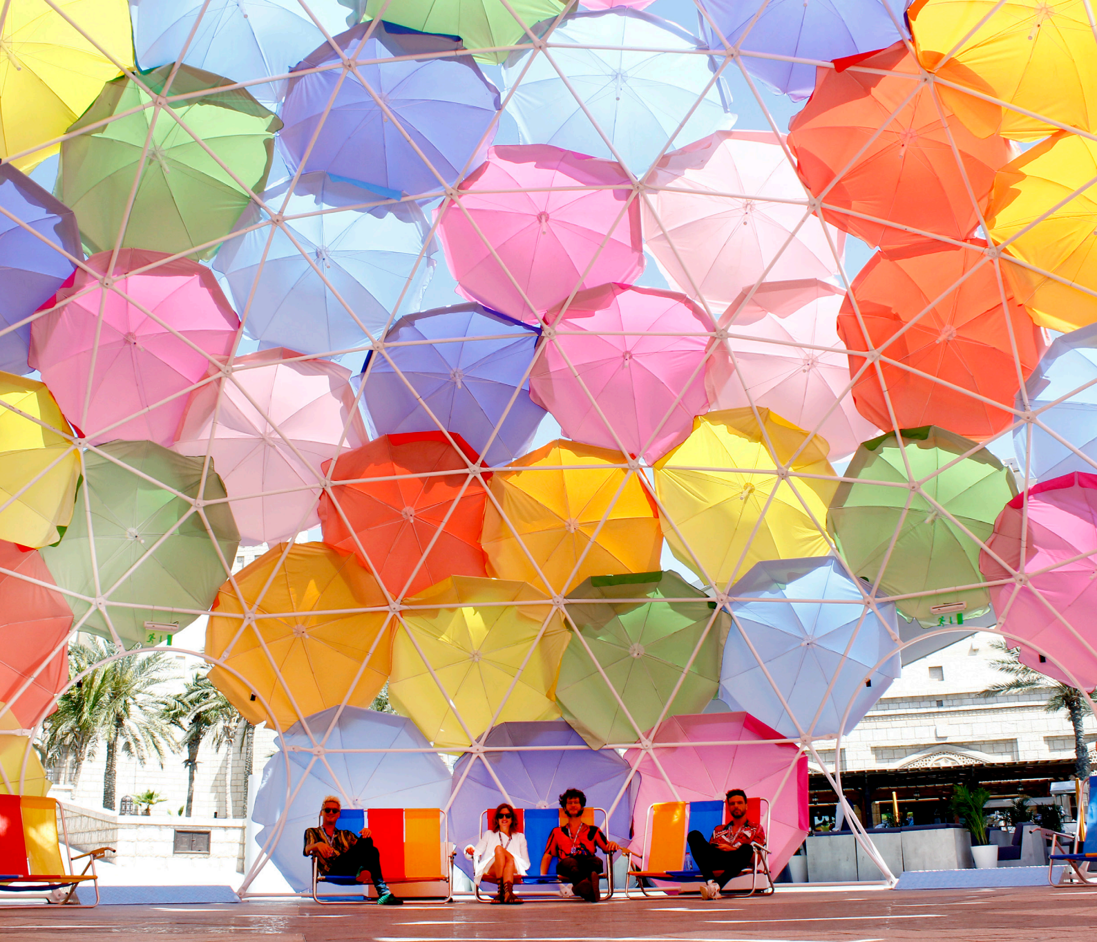
Fig 9. Solaroca_MG_2580 _ Solaroca, 2019