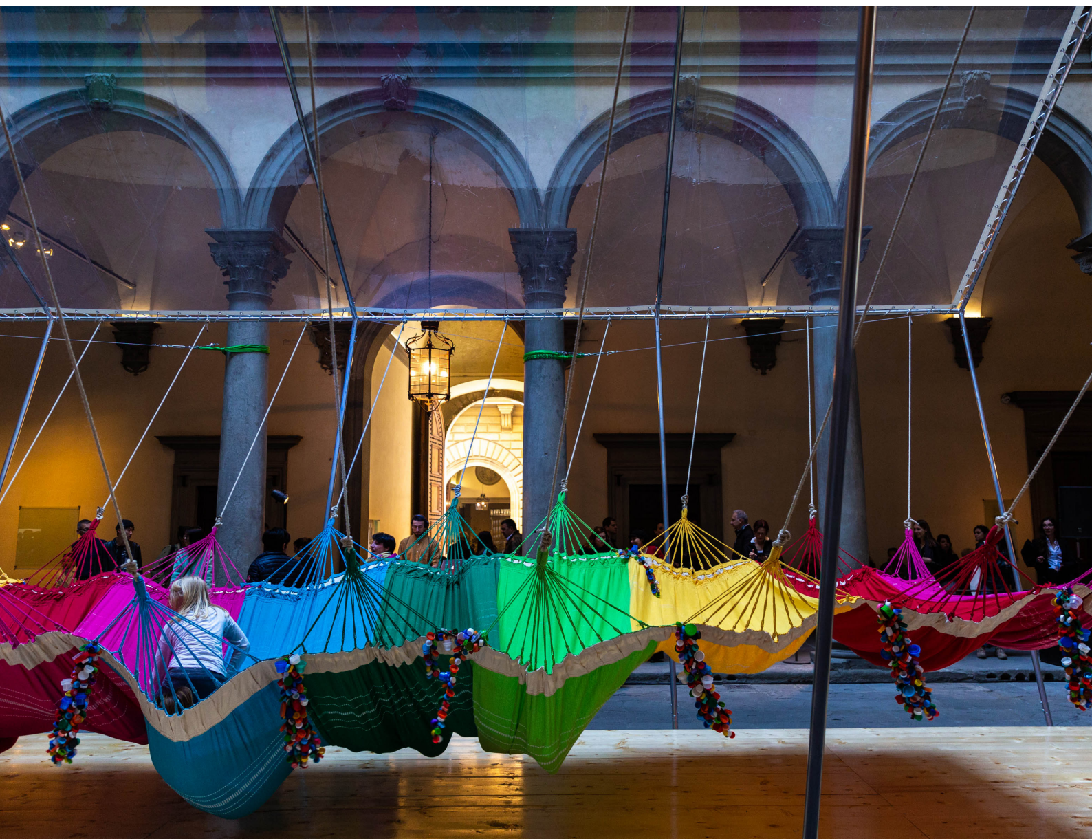
Fig 5. Rede social_ X2B5958 _ Rede social, 2017