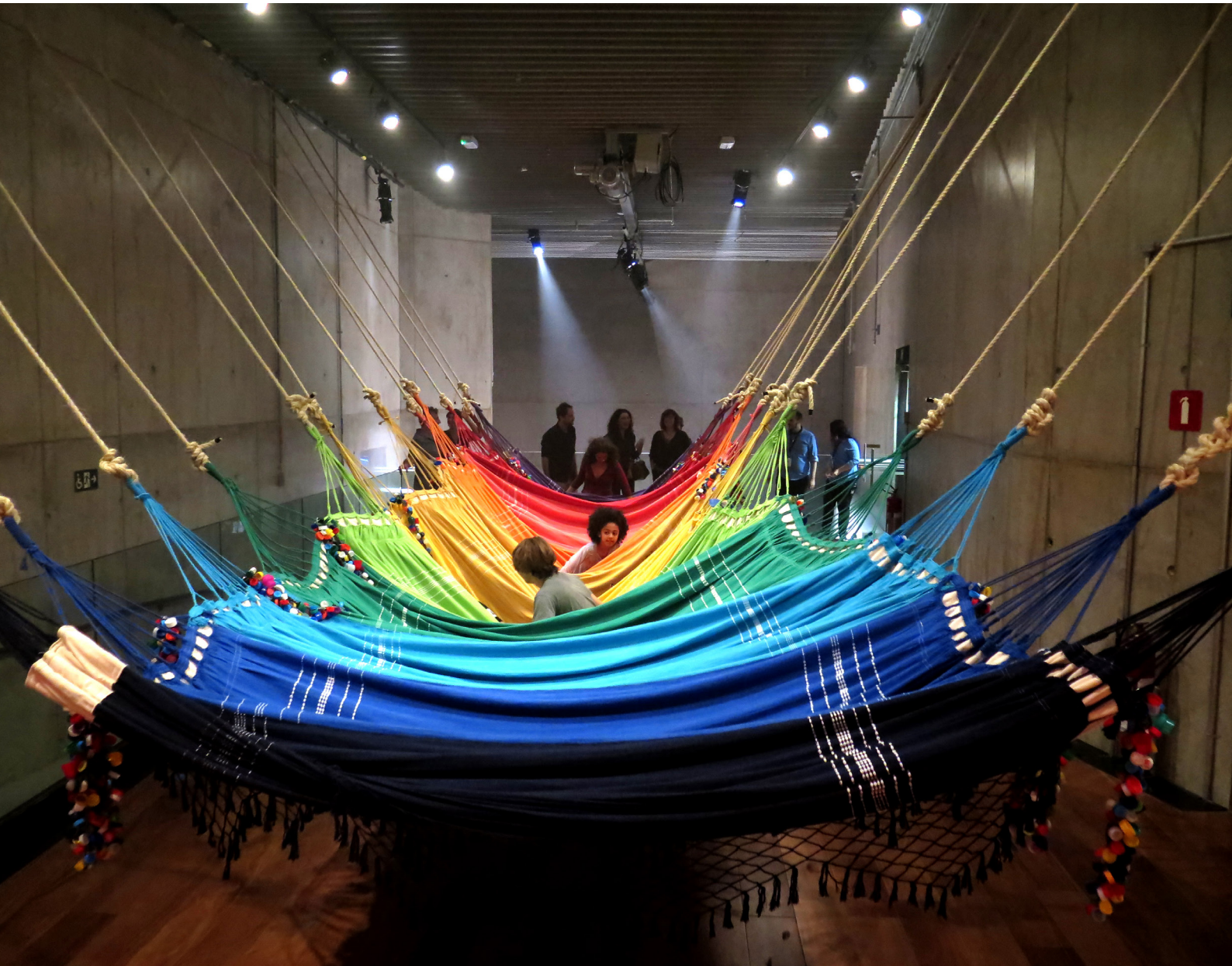
Fig 8.1. Rede social_IMG_7456 _ Rede social, 2019