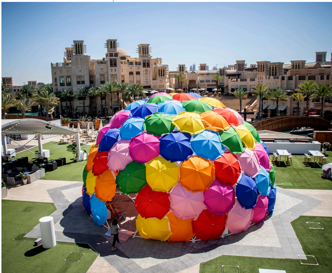
Fig 11. Solaroca _20190319_619A5584_ Solaroca, 2019