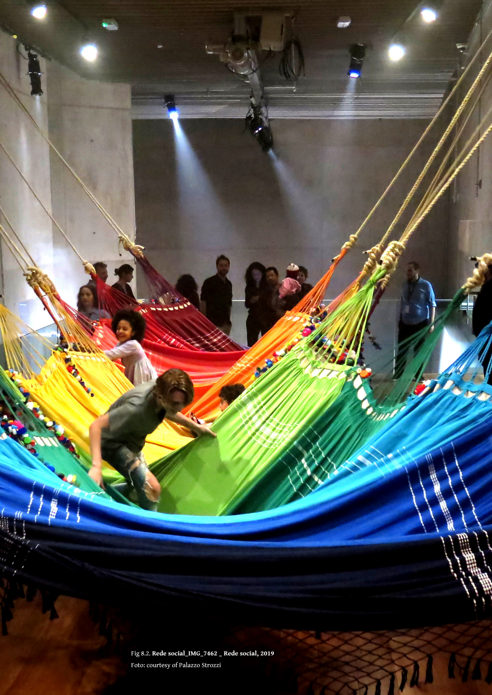
Fig 8.2. Rede social_IMG_7462 _ Rede social, 2019