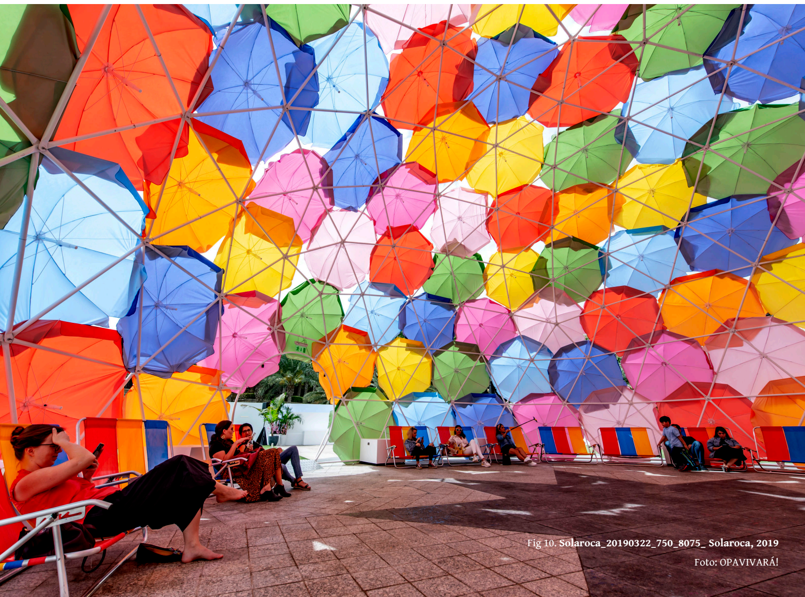
Fig 10. Solaroca_20190322_750_8075_ Solaroca, 2019

A obra foi comissionada pela feira de arte de Dubai, em sua edição de 2019. Nesse contexto, pensamos nas relações entre a praia e o deserto e a demanda desses ambientes por abrigos que possam oferecer sombra. Tanto asocas dos povos originários do Brasil, quanto as tendas dos povos Tuaregues do Deserto do Saara, são estruturas arquitetônicas que remetem à forte organização comunitária dessas culturas, suas dinâmicas nômades e suas capacidades de adaptação ao ambiente.