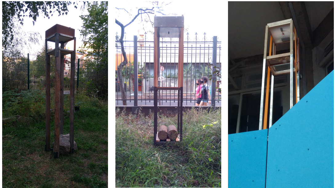
Figura 3 Montagens em Berlim, Ribeirão Preto e Campo Grande (a partir da esquerda)