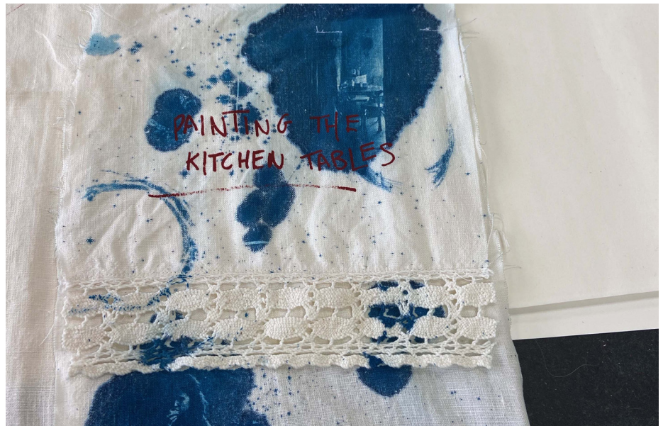
Figura 1. Cianótipo azul para manchas de tinta, anéis de caneca de café e uma representação tátil do caos doméstico.

A tinta azul do cianótipo está espalhada pelo pano (Figura 1), imitando vinho derramado, manchas de xícara e o caos geral dentro da cozinha. Expostas no ciano estão as imagens da vida doméstica e das mulheres dentro delas. Isso comunica as lembranças físicas que a interação humana com as cozinhas deixa e como as histórias dessas interações perduram.