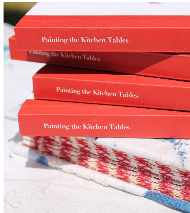
Figure 5. The two versions of the publication, one with a perfect bound spine that allows for focus towards the content within. The French handbound spine of the hardback edition is left open to expose the red threads, latticing together the colour and textural cues spread across the research and throughout the publication.