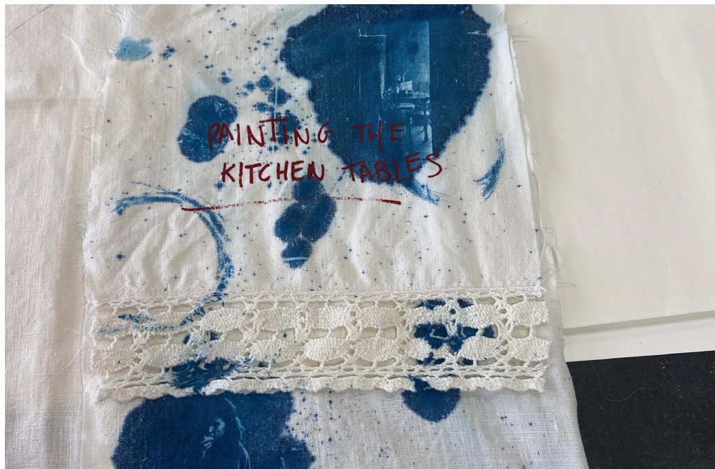
Figure 1. Blue cyanotype for ink stains, coffee mug rings, and a tactile depiction of domestic chaos.

The completed cloth (Figure 2) became a portable table, shifting from an object to clothing the table and becoming the figurative foundation and the project's namesake.