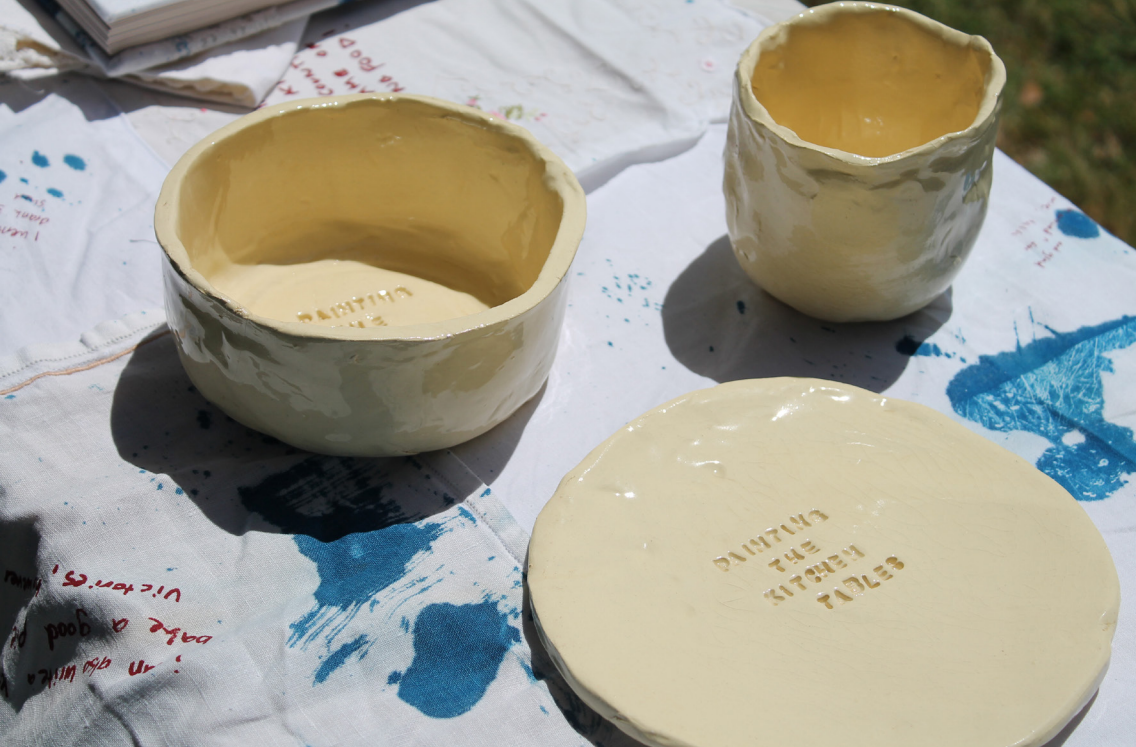
Figura 9. A série de cerâmica, deixada branca e sem pintura para permitir mais criações em espaços domésticos e para que a comida contida nelas “pinte” a tela em forma de cerâmica.