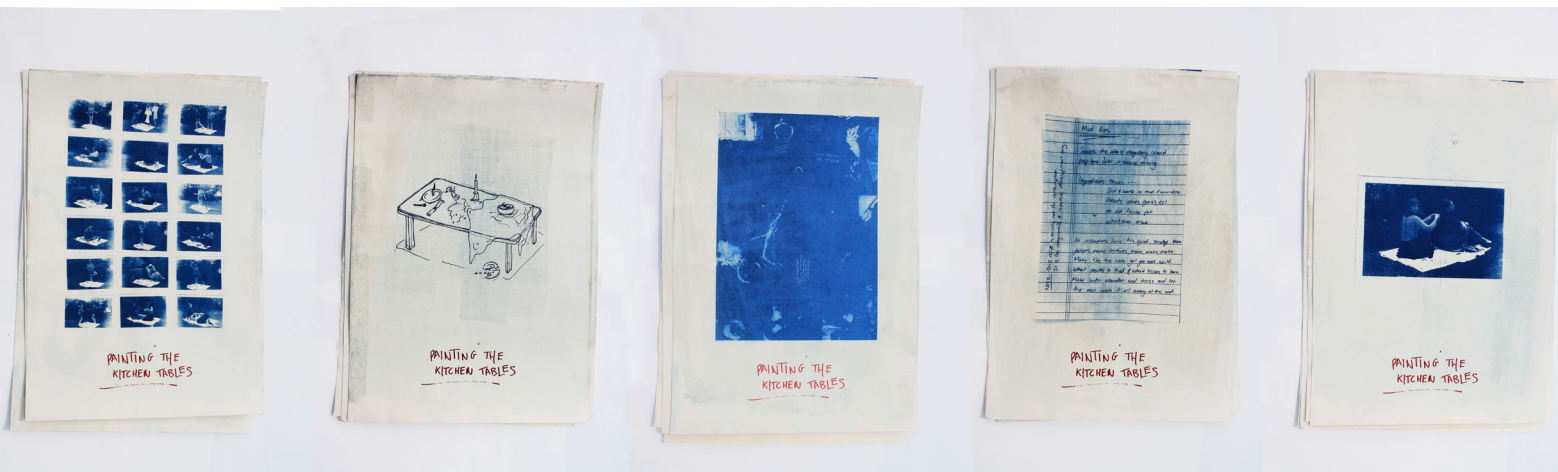
Figura 8. Com a intenção de estender a pesquisa além da publicação, os pôsteres fornecem uma destilação visível da garantia. Destina-se a ser alojado em Tamaki Makaurau, encapsulando as pistas visuais e as características de todo o projeto.

Outro resultado de design do projeto é a série de pôsteres feitos novamente em cianotipia e serigrafia. Esses pôsteres incluem cinco impressões da série de fotos, uma mesa desenhada, uma textura de toalha de mesa e um cartão de receita de Mud Pies. O título do projeto é impresso na tela na parte inferior (Figura 8).