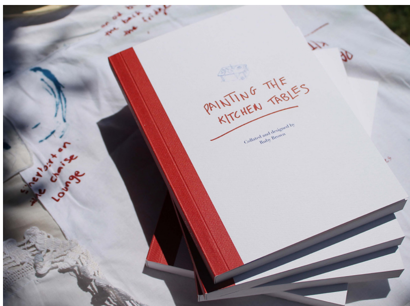
Figure 7. The pocketbook version of the publication, in paperback form, designed with a red spine to emulate cookbooks and kitchen measuring utensils. With the content as the focus, this output employs a minimalistic approach to invoking the visual themes across the research collateral.

The second edition is a pocketbook for a more versatile reading experience, with perfect-bound binding. The cover is designed to emulate old cookbooks, with a red spine and a drawn table on the cover (Figure 7). The inside of the cover shows a scanned image of the tablecloth, so the visual cues of handmade aspects link the pocketbook to the primary publication. Both versions of the book offer the same content - yet differ in purpose. The primary publication is a compilation of texture - it is intended to be a touchpoint of tactility to encapsulate the handmade aspects aimed to be communicated - a physical homage to women's spaces in the kitchen. The pocketbook is designed to hold the content in focus, intended to be read.