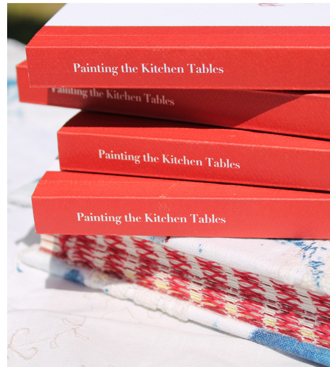
Figura 5. As duas versões da publicação, uma com lombada perfeita que permite o foco no conteúdo. A lombada encadernada francesa da edição de capa dura é deixada aberta para expor os fios vermelhos, entrelaçando as dicas de cor e textura espalhadas pela pesquisa e por toda a publicação.