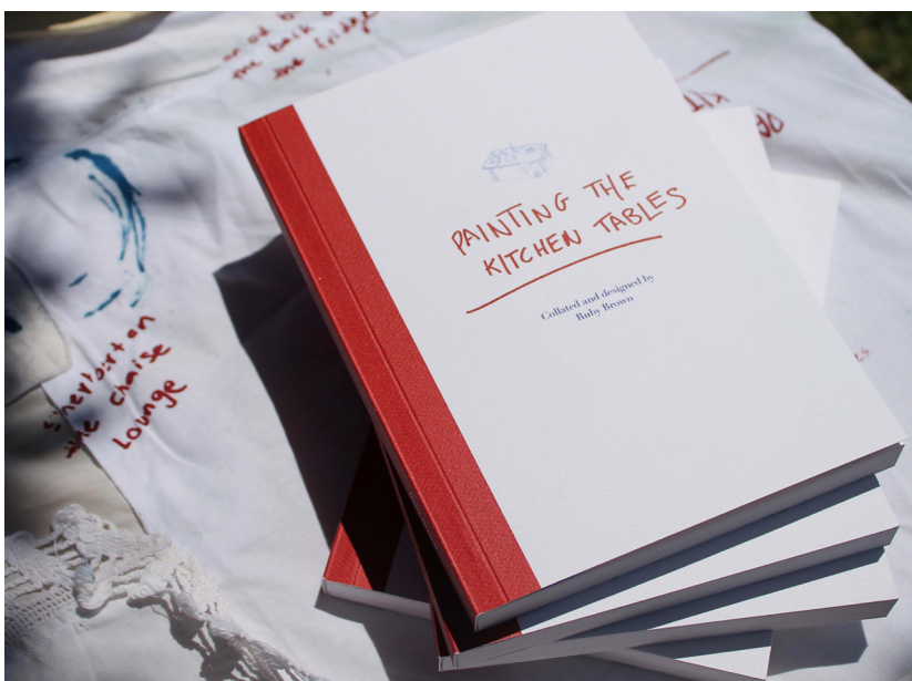
Figura 7. A versão em livro de bolso da publicação, em brochura, desenhada com lombada vermelha para simular livros de receitas e utensílios de medição de cozinha. Tendo o conteúdo como foco, esta saída emprega uma abordagem minimalista para invocar os temas visuais em todo o material de pesquisa.

A segunda edição é um livro de bolso para uma experiência de leitura mais versátil, com encadernação perfeita. A capa foi desenhada para imitar antigos livros de culinária, com lombada vermelha e uma tabela desenhada na capa (Figura 7). O interior da capa mostra uma imagem digitalizada da toalha de mesa, de modo que as dicas visuais de aspectos feitos à mão vinculam a carteira à publicação principal. Ambas as versões do livro oferecem o mesmo conteúdo - mas diferem em propósito. A publicação principal é uma compilação de texturas - pretende ser um ponto de contato de tátil para encapsular os aspectos artesanais que se pretende comunicar - uma homenagem física aos espaços femininos na cozinha. O livro de bolso é projetado para manter o conteúdo em foco, destinado a ser lido.