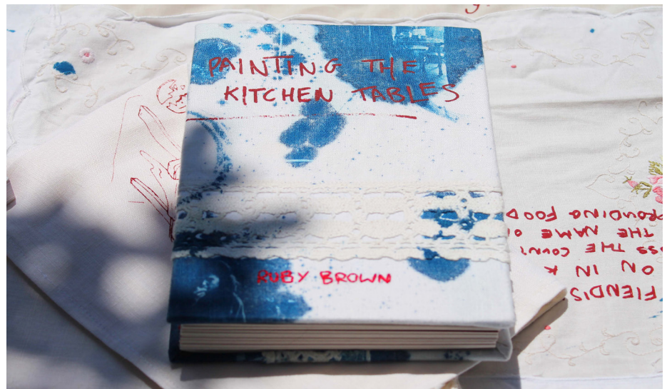
Figura 6. A versão em capa dura da publicação concentra-se em uma experiência textual e atua como um ponto culminante das experiências e da criatividade das mulheres nos espaços domésticos. Destina-se a ser vivido ao lado, tocado e interagido.

A capa do livro é baseada na toalha de mesa, com os mesmos guardanapos, título serigrafado e imagens em cianotipia (Figura 6). A capa dura é deixada sem lombada para expor a encadernação manual com linha de bordar - como se o livro fosse um projeto de bordado. O motivo vermelho da capa serigrafada é emulado através do fio vermelho e entrelaça o livro como se fosse a toalha de mesa.