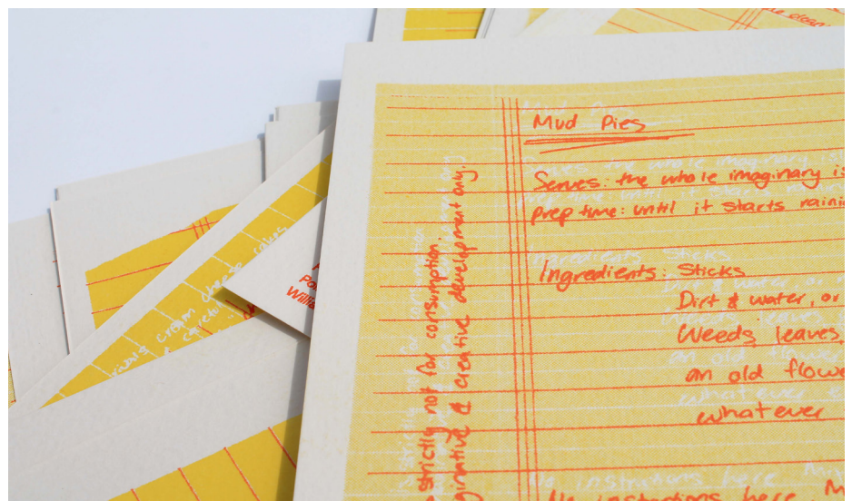
Figura 3. Uma receita de Mud Pies (estritamente não para consumo, apenas para desenvolvimento imaginativo).

Coletadas de Recipes for Resistance: Feminist Political Discourse About Cooking (Williams, 2017) ao lado de textos de autoria própria, as receitas estão espalhadas por toda a publicação como pontos de educação e entretenimento. As receitas são principalmente de autoras feministas preocupadas com a comunidade, principalmente veganas e anticapitalistas. As receitas de autoria própria (Figura 3) são baseadas no humor a partir de memórias e experiências pessoais, para recriar uma atmosfera das formas como as mulheres ocupam o espaço na cozinha. Essas receitas são manuscritas e digitalizadas na publicação, escrita em clássico papel de nota vermelho e amarelo para comunicar um ponto de familiaridade para o leitor.