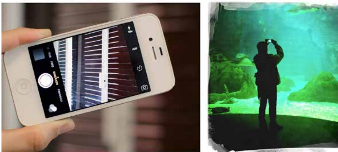
Figura 1 Imagem vista pela tela do celular (imagem à esquerda) e a manipulação deste tipo de câmera (imagem à direita)

Aproximando um pouco da prática fotográfica, estas diferenças se evidenciam em um processo criativo, visto que cada câmera coloca o fotógrafo em contato com o assunto de forma distinta. Isto fica evidente na maneira como ocorre a manipulação da câmera em função de suas características e na forma como o olhar é dirigido ao visor, como podemos verificar a seguir. No exemplo aqui apresentado, foram usados dois tipos de câmera com o objetivo de investigar na prática uma reflexão teórica acerca do dispositivo fotográfico: uma câmera DSLR 2 e uma câmera de celular. Por possuírem estruturas diferentes, foi possível verificar como ocorre a percepção do espaço em função do visor que cada uma delas dispõe. Com o celular, a imagem é visualizada na tela ao mesmo tempo em que é possível visualizar todo o entorno que está fora desta imagem. Neste caso, o olho fica afastado da câmera e os braços se expandem em direção ao assunto (Figura 1).