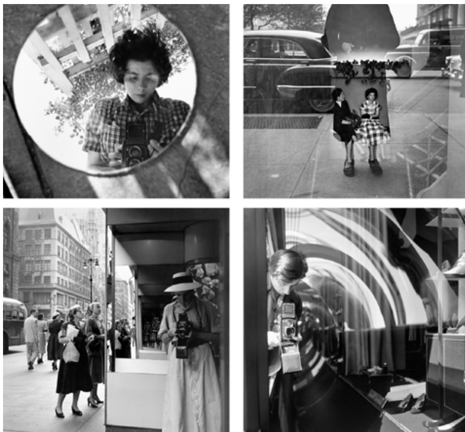
Figura 5 Série de autorretratos de Vivian Maier. Disponível em: http://www.vivianmaier.com/gallery/self-portraits/ . Acesso em: 30 de março de 2018.

A câmera utilizada por ele era uma Leica , rápida e ágil, e esta escolha estava diretamente relacionada ao tipo de fotografia que ele fazia. Em sua fotografia não havia espaço para recortes posteriores, a imagem tinha que acontecer no instante da cena. Neste caso, a foto é fruto de uma relação muito bem sincronizada entre o corpo do fotógrafo, o qual o mobiliza pelo espaço, e a câmera fotográfica.