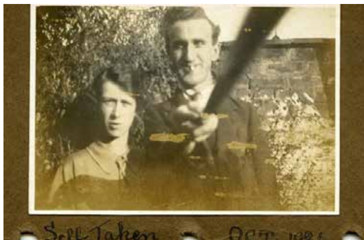
Figura 4. Fotografia de 1926 indica o uso pioneiro de um bastão na produção de um autorretrato. Disponível em: < http://oglobo.globo.com/sociedade/tecnologia/fotografia-de-1926-mostra-uso-pioneiro-de-pau-de-selfie-14908747 >. Acesso em: 30 mar 2018.

Não é novidade também que a indústria trabalha em função das necessidades humanas e que estas correspondem a um mercado de consumo. Nesse sentido, é possível identificar uma relação direta entre um determinado uso e as adaptações feitas em função de uma necessidade. Assim, percebemos que a invenção de novos tipos de câmeras, ainda que estejam diretamente vinculadas ao mercado, têm relação direta com a construção de novos pontos de vista. Num contexto de um processo de criação, estes pontos de vista estarão vinculados diretamente ao discurso do fotógrafo/artista.