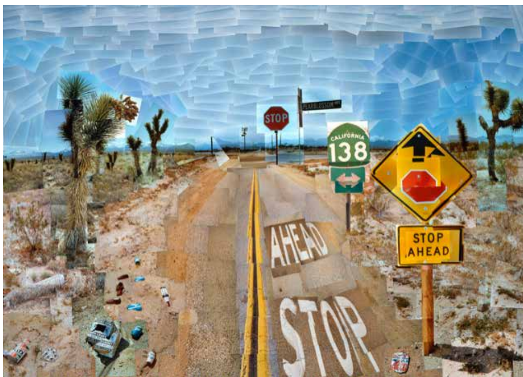
Figura 7 David Hockney, “Pearblossom Highway”, 1986, colagem fotográfica, 181.6 x 271.8 cm.

Mesmo que este pensamento provoque controvérsias entre alguns pesquisadores, o que nos interessa é observar que o modo como ele desenvolve o seu ponto de vista aproxima-se do assunto aqui tratado, tanto em seu trabalho de colagens de fotografia como em sua pesquisa sobre a pintura. Tratam-se de leituras complementares que ajudam na análise do dispositivo fotográfico e se manifestam de modos variados em diversos trabalhos. Nesse sentido, é possível encontrar um campo vasto a ser investigado.