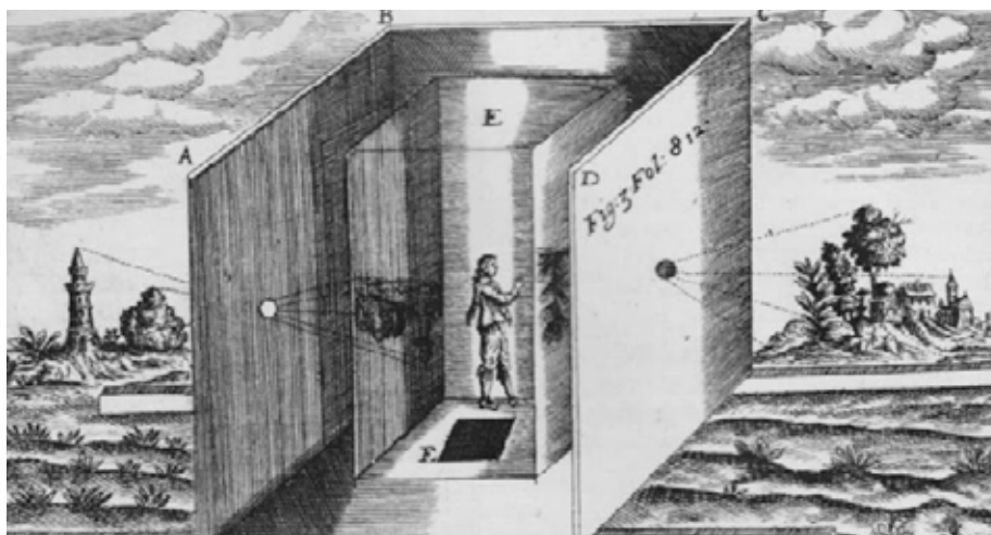
Figura 3 Athanasius Kircher, “Ars magna lucis et umbrae”, 1646.

A ideia de um sujeito interiorizado na câmara indicava um posicionamento de um observador capaz de ter uma visão verdadeira do mundo, ideia esta que mudaria a partir do século XIX. De maneira geral, a câmara escura pode ser descrita como um quarto ou mesmo uma caixa com um pequeno e único orifício por onde entra a luz proveniente de uma área externa. A imagem da área externa é projetada no interior do quarto ou caixa de forma invertida, resultado de um fenômeno óptico. Em sua versão mais simples, a imagem é projetada no interior da câmara e não apresenta exatidão no foco, possuindo pouca nitidez. Trata-se de um aparato que possibilita um determinado tipo de observação, ou seja, temos na câmara escura uma situação que indica um tipo de relação entre o sujeito e o dispositivo.