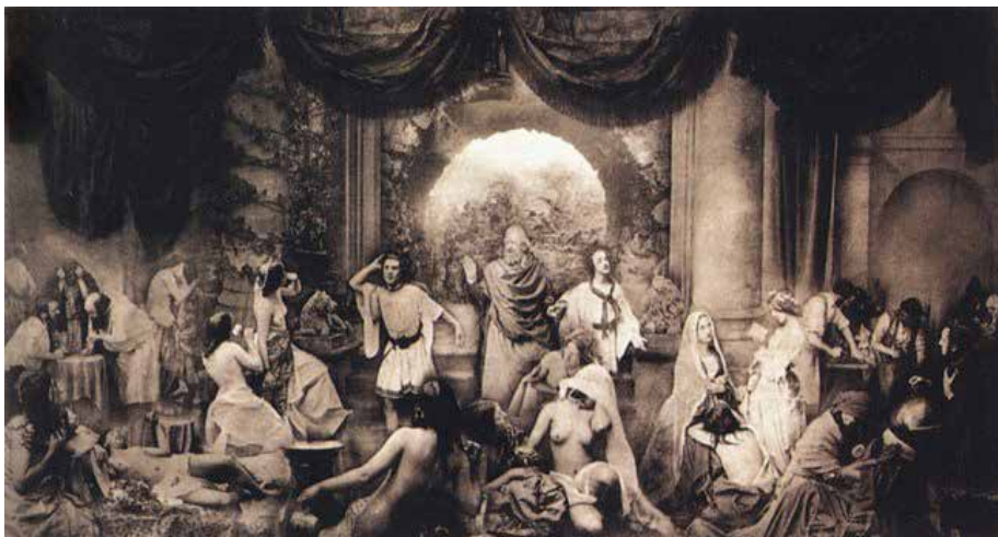
Figura 6 Oscar Gustav Rejlander, “Dois modos de vida”, 1857, fotomontagem, 41 x 79 cm.

De maneira diferente, no trabalho do artista inglês David Hockney, a colagem de fotos é intencionalmente utilizada, fazendo-se visível e tornando-se um elemento poético. Utilizando aproximadamente setecentos e cinquenta fotografias, “Pearblossom Highway” (Figura 7), assume as imperfeições da sobreposição das imagens, tomadas em diferentes horas do dia.