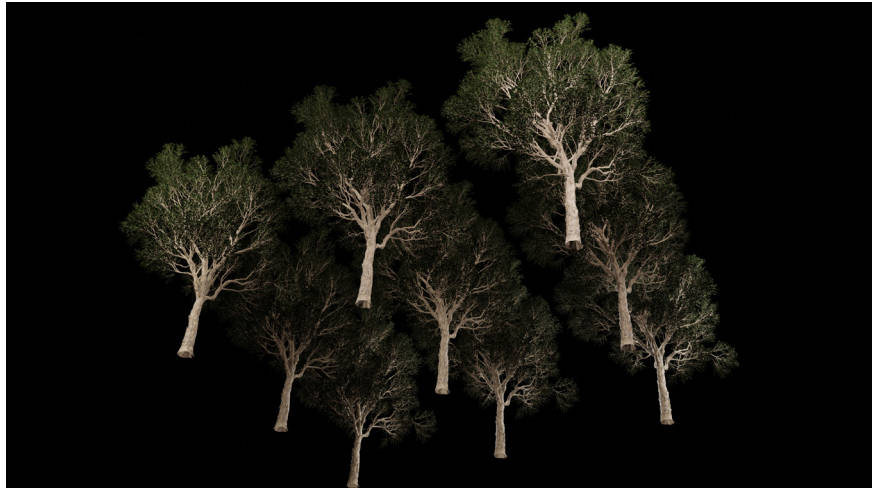
Figura 6: Módulo 3X3 de cópias dos modelos tridimensionais de eucaliptos.

Na instalação, colocamos um sensor ultrassônico acoplado a um microcontrolador, que permite medir a variação de distância entre dois objetos a partir do deslocamento temporal. O sensor envia e recebe ondas, e com base na diferença temporal entre o envio e recebimento do mesmo sinal, pode calcular a distância (BARRALAGA, 2022).